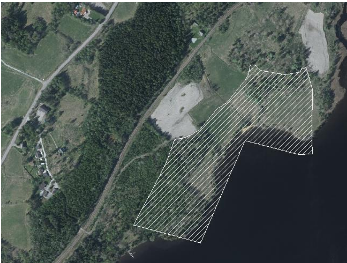
Planområdets läge vid sjön Vevungen